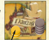
Beispiel 6: Gelb ist am Zug. Er hat eine Warenmarke mit 1 Faß und eine Marke mit 2 Fässern offen vor sich und das Schiff liegt in Danzig. Dort hat Grau 4 Stände und Gelb hat 2 Stände. Er gibt die Marke mit den 2 Fässern ab, baut 2 weitere Stände und hat nun genau so viele Stände wie Grau.

Hinweis: Das Bewegen des Schiffs zählt nicht als Aktion in einer Stadt.