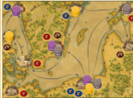
Beispiel 3: So könnte eine Startaufstellung bei 3 Spielern aussehen.

Der Spieler kann darauf verzichten Aktionen durchzuführen.